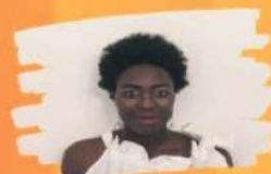
Tavola rotonda aperta a tutta la popolazione in cui saranno presenti gli ospiti e altri esperti